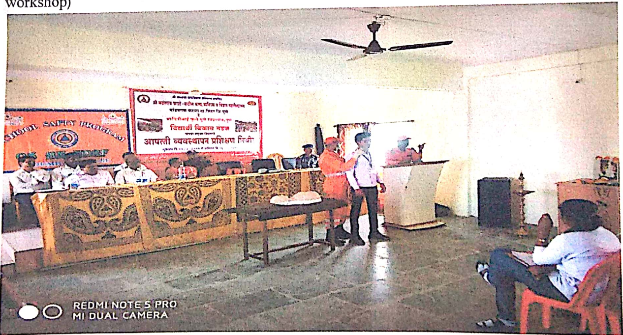
आपत्ती व्यवस्थापनाचे प्रशिक्षण देताना एन. डी.आर.एफ. चे अधिकारी व सहभागी विद्यार्थी (NDRF during disaster management training. Soldiers and students )